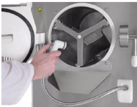
Praktisk dusch med manuell kontroll