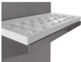
Höj-och sänkbar hylla med halkfri matta