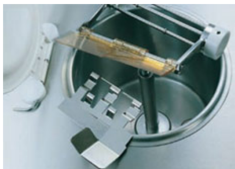
Special designad omrörare med avtagbar stöd