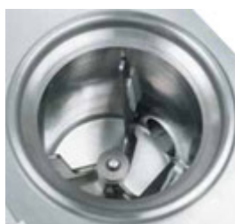
Omröraren i cylindern