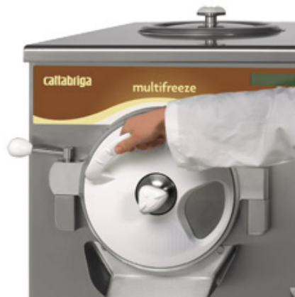
Ny värmeisolerande, ergonomisk, avtagbar och svängbar dörr