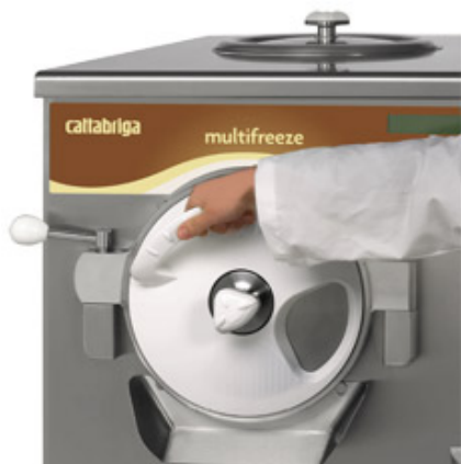
Ny värmeisolerande, ergonomisk, avtagbar och svängbar dörr